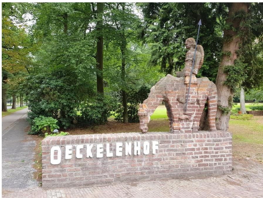
De Oeckelenhof in Harendermolen, rechts van het huis Haaksbergen

In 1878 overleed Petrus van Oeckelen. De orgelmakerij, sinds 1856 bekend onder de firmanaam P. van Oeckelen & Zonen, werd voortgezet door twee van zijn zonen: Cornelis Aldegundis (1829-1905) en Antonius (1839-1918). De orgelmakerij heeft daarmee een eeuw bestaan: van 1818 tot 1918. In die periode werden ruim honderd orgels gebouwd en ongeveer veertig orgels verbouwd en/of uitgebreid, vooral in de provincies Groningen en Drenthe.